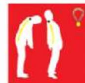
Medaille: Bewegung vor und zurück