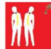
Palme: Bewegung nach links und rechts